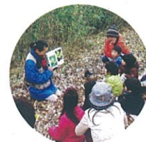
もっと聞かせて生きもののお話