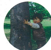
木にぎゅーっ! あったかいね。