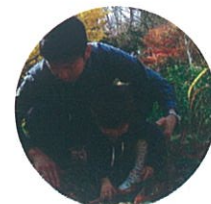
パパといきもののおうちつくったよ♪