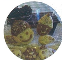
自分で拾ったドングリ入りクッキー!