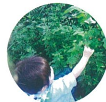
あま〜い木の实! 鳥さんも食べてたよ♪