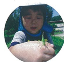
ふれるってドキドキするね!