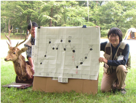
プログラムのサポート ・シカの個体数変動を知る