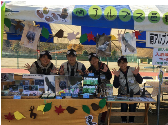
お祭りでの野鳥公園ブースでプログラム