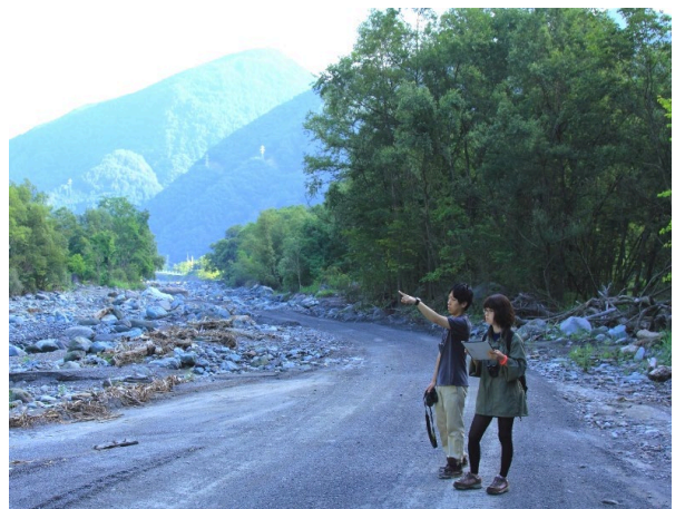
野鳥センサス調査に同行