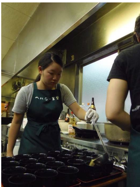
ヘルシー美里にて配膳サポート