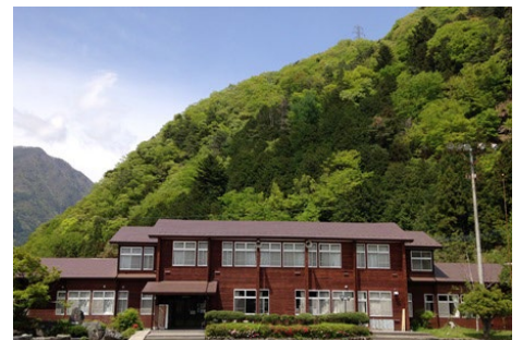
校舎の宿 ヘルシー美里