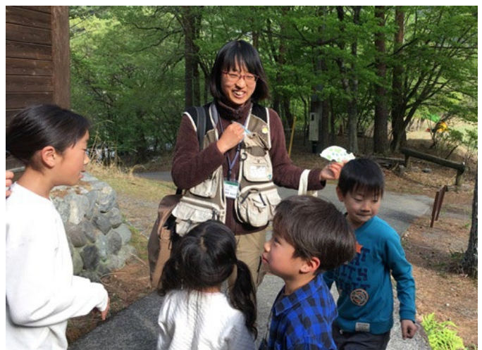
子供たちのプログラムに参加